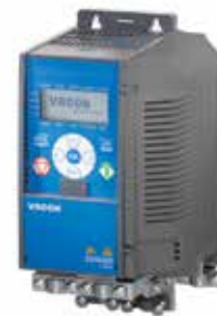
Kit de montagem de placa opcional