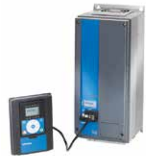
Kit de montagem de porta do teclado